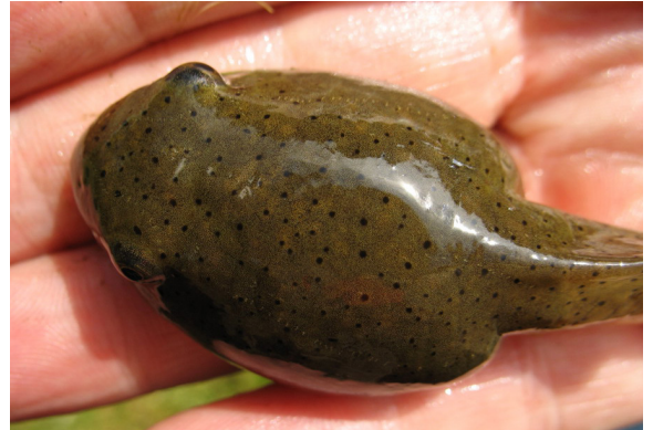
Larve Amerikaanse stierkikker

Niet alle kikkers die een hard geluid maken zijn stierkikkers. Graag foto's nemen van de kikkervissen of de kikkers om de herkenning door deskundigen te laten bevestigen. Ook een geluidsopname (GSM!) is daarbij heel handig.